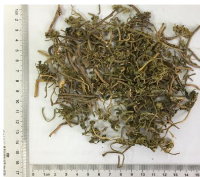
图 1 阴地蕨饮片