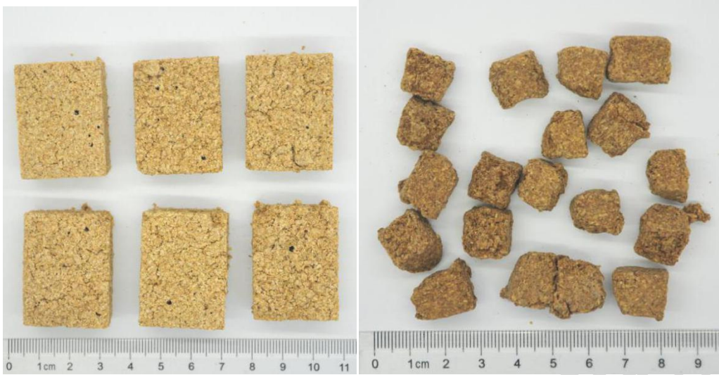
图 1 六神曲（左）与焦六神曲（右）饮片图